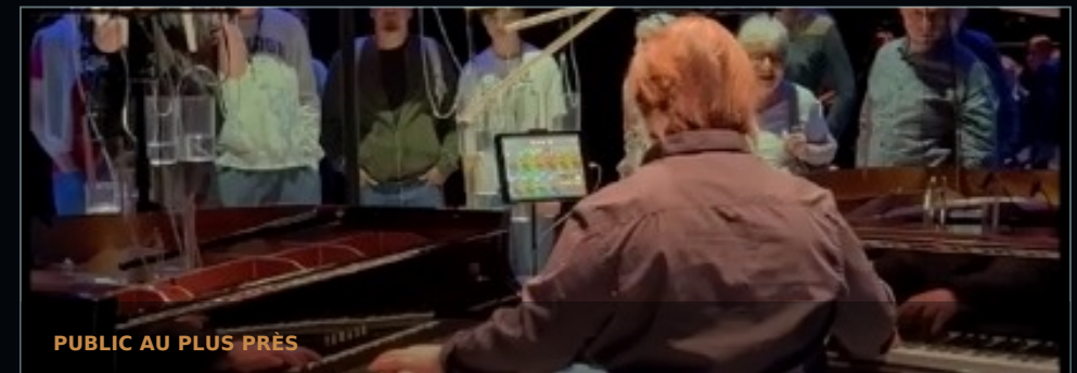
PUBLIC AU PLUS PRÈS